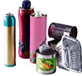
Aérosols, boîtes de conserve, bidons métalliques, canettes