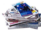
Journaux, magazines et prospectus