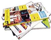
Annuaire et catalogues