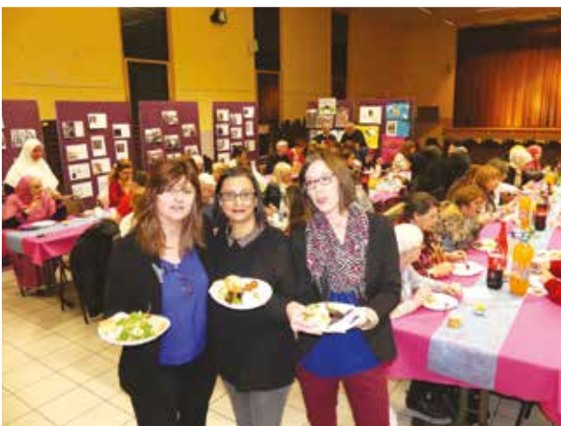
Repas partagé À table!