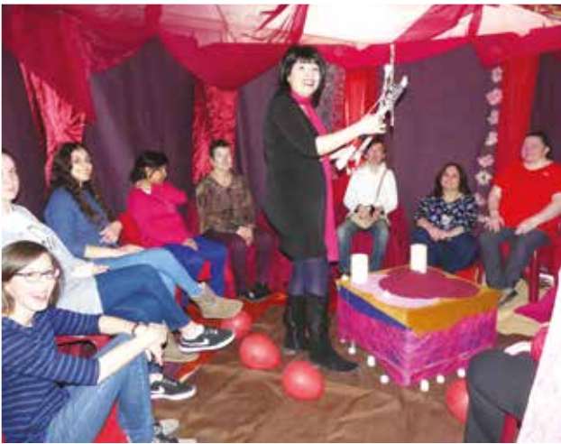
Atelier bâton rouge Prenons la parole...