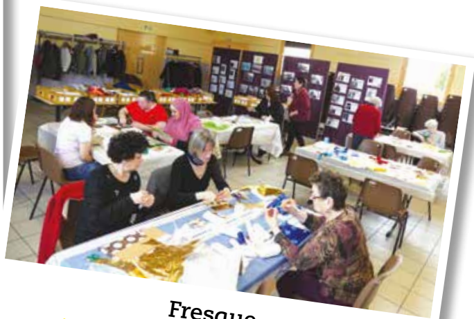
Fresque Donnons des couleurs à la vie!