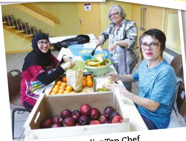
Atelier Top Chef Cuisinons ensemble