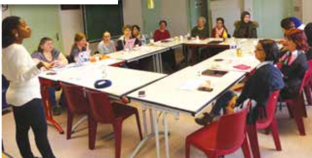
Atelier soins du visage