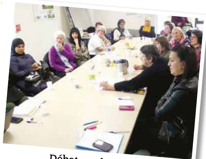
Débat sur la laïcité