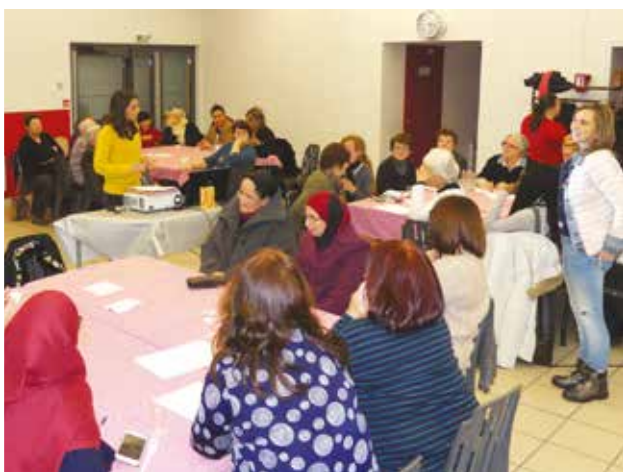
Rencontre entre femmes

La Semaine des Femmes orchestrée par la Municipalité, avec le concours du Centre socioculturel Arc-en-ciel, a fédéré les élues et les habitantes autour du thème de la laïcité, et permis d'éclairer cette notion destinée à ce que « chacun puisse vivre en paix, dans la diversité des croyances et des opinions ». Les animations ont favorisé les rencontres pour se cultiver, débattre, créer, partager, rire et s'émuouvoir. Retour en images sur une semaine riche de sens.