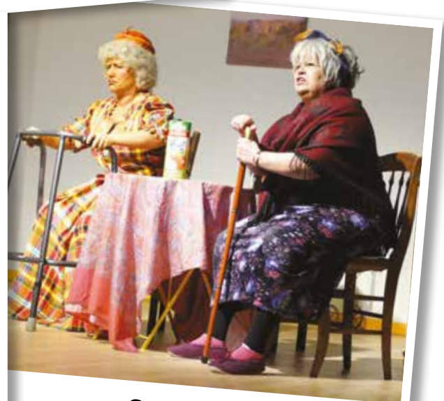
Spectacle Finir sur un éclat de rire!