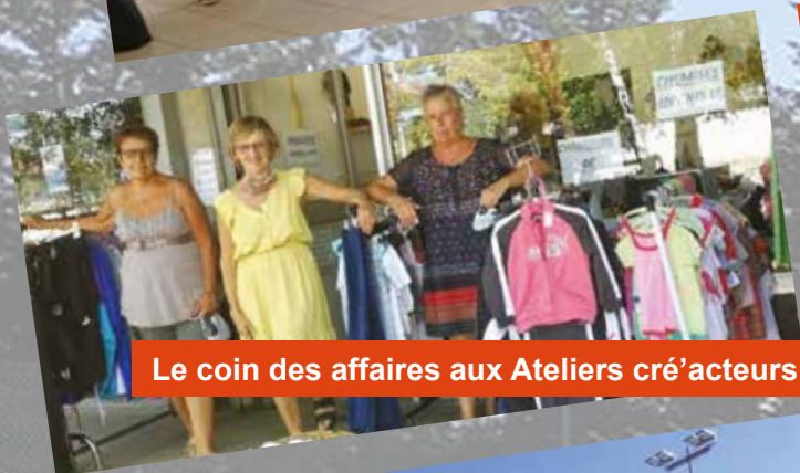
Le coin des affaires aux Ateliers cré'acteurs