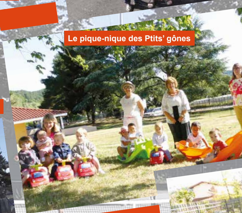
Le pique-nique des Ptit's gônes