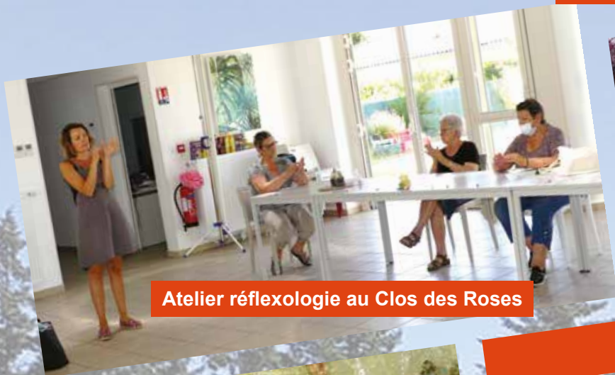
Atelier réflexologie au Clos des Roses