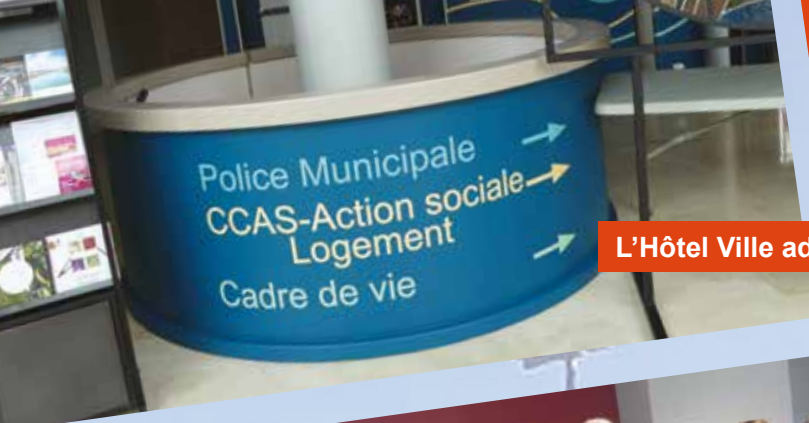
L'Hôtel Ville adopte une nouvelle signalétique