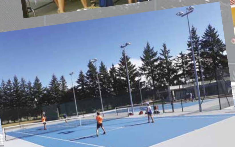
Balle de match sur des courts neufs