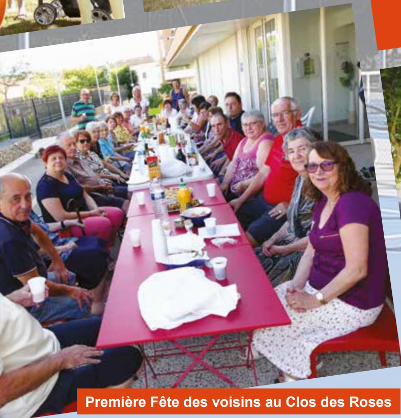
Première Fête des voisins au Clos des Roses