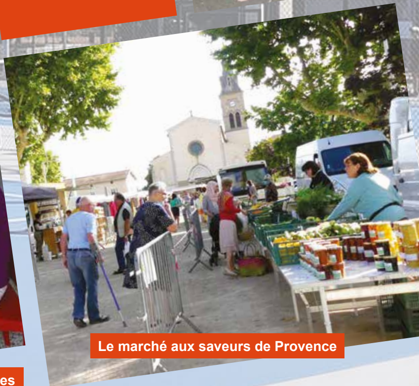
Le marché aux saveurs de Provence