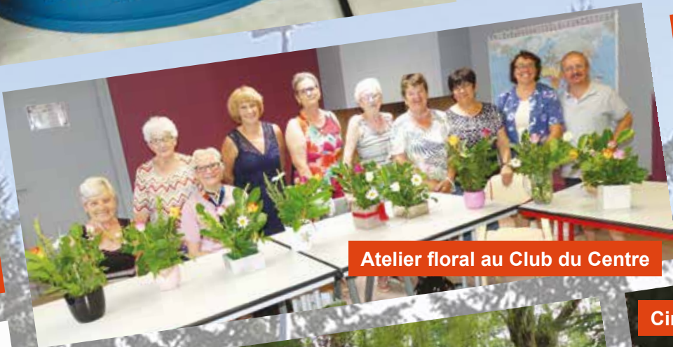
Atelier floral au Club du Centre