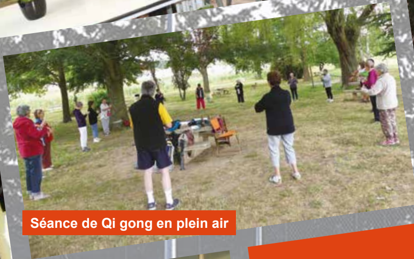
Séance de Qi gong en plein air