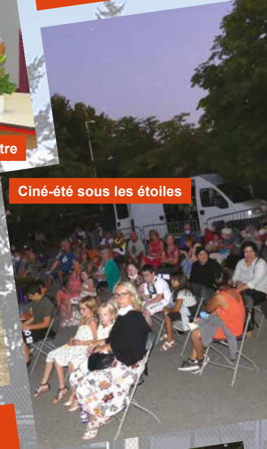
Ciné-été sous les étoiles